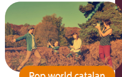
Pop world catalan

Le groupe Calle Alegria chante en Castillan et concentre son ambiance typique dans une musique pop aux sonorités électro. Avec des éléments empruntés à la pop, au groove et à l'électro, sa musique se révèle actuelle et puissante mais laisse apparaître une générosité communicative particulièrement remarquable lors des prestations live.